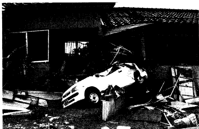
写真-1 刈谷田川(破堤点付近)

避難しないのは情報がないからなのだろうか。避難情報が伝達されても避難しない住民がきわめて多い現実を踏まえるならば、問題はそれほど単純ではないことがわかる。浸水が相当に進み危険な状態にあっても、避難勧告が発令されなければ避難しない住民は、情報への過剰依存と言わざるを得ないであろうし、災害対応を過剰に行政に委ねていることにおいて、災害過保護の状態にある